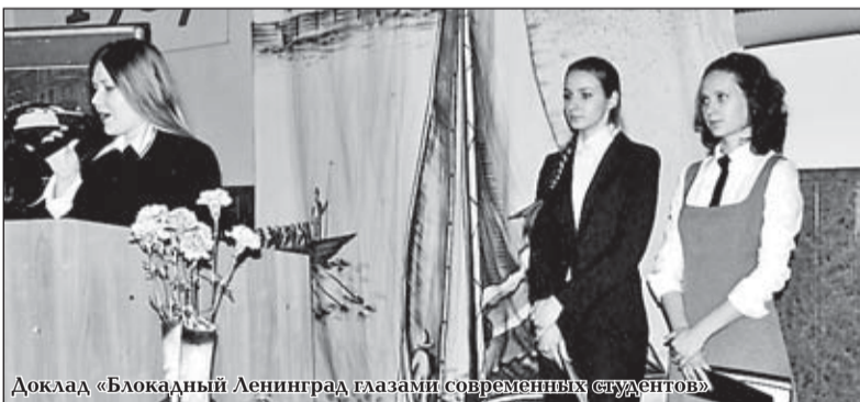
Доклад «Блокадный Ленинград глазами современных студентов»

Все работы участников конкурса явились достойным украшением мероприятия, а победители получили грамоты и благодарности от его организаторов.