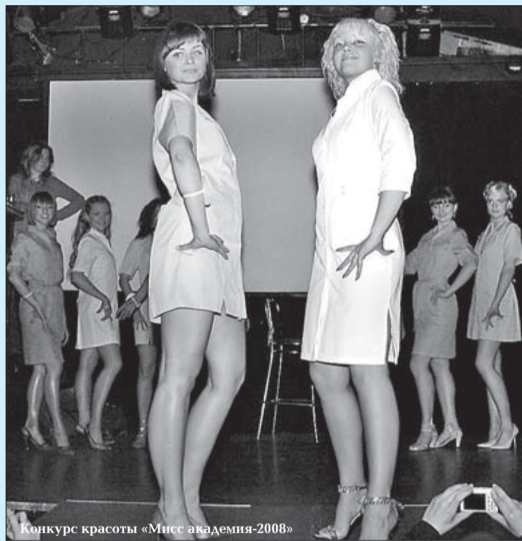
Конкурс красоты «Мисс академия-2008»

Профком студентов — орган студенческого самоуправления, стоящий на защите социальных интересов учащихся. В свободное от этого благородного дела время занимается досугом студентов. Самые известные проекты: ежегодная школа профактива «Маяк», проходящая в одноименном пансионе, интеллектуальный чемпионат «Что? Где? Когда?», конкурс «Мисс