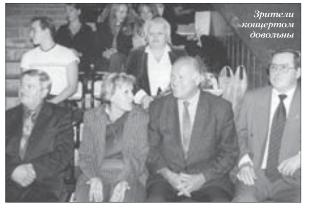
Зрители концертом довольны