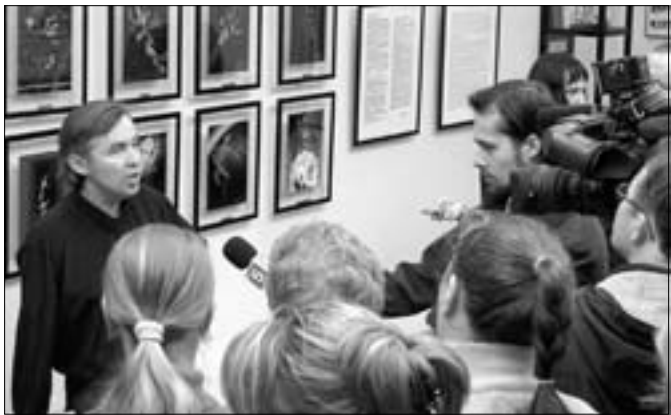
Открытие выставки 12 ноября 2004 года.